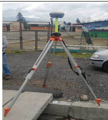
FOTOGRAFIA DEL MOJON O SITIO DONDE SE ENCUENTRA EL MOJÓN