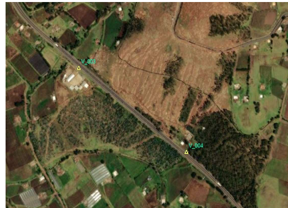
UBICACIÓN EN IMAGEN O FOTOGRAFÍA DEL VERTICE