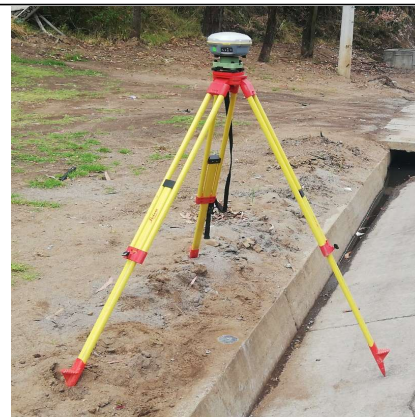
FOTOGRAFIA DEL MOJON O SITIO DONDE SE ENCUENTRA EL MOJÓN