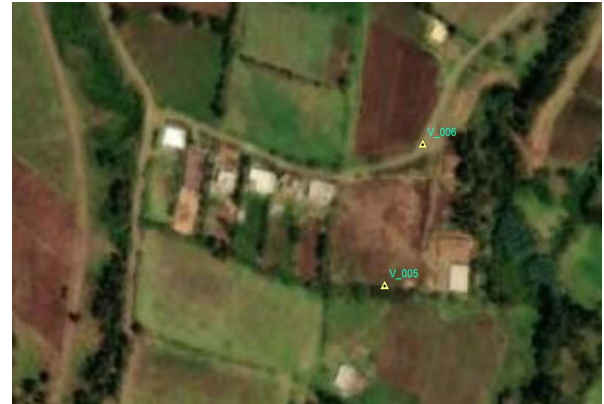
UBICACIÓN EN IMAGEN O FOTOGRAFÍA DEL VERTICE