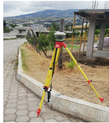
FOTOGRAFIA DEL MOJON O SITIO DONDE SE ENCUENTRA EL MOJÓN