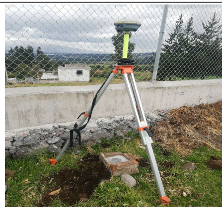
FOTOGRAFIA DEL MOJON O SITIO DONDE SE ENCUENTRA EL MOJÓN