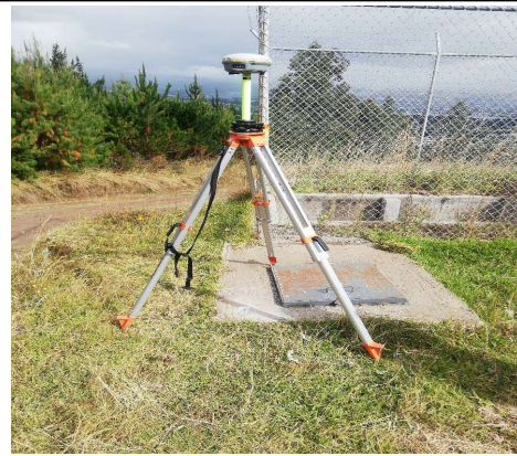
FOTOGRAFIA DEL MOJON O SITIO DONDE SE ENCUENTRA EL MOJÓN