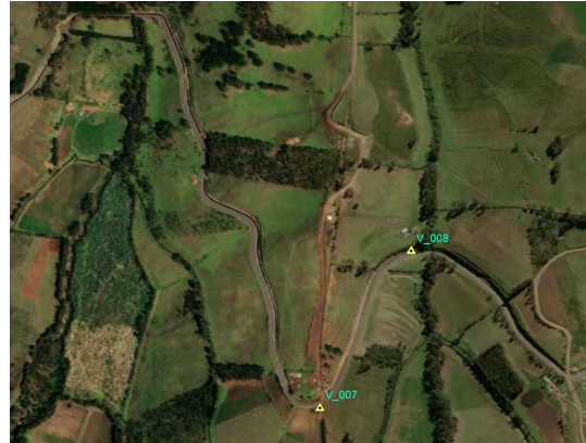
UBICACIÓN EN IMAGEN O FOTOGRAFÍA DEL VERTICE