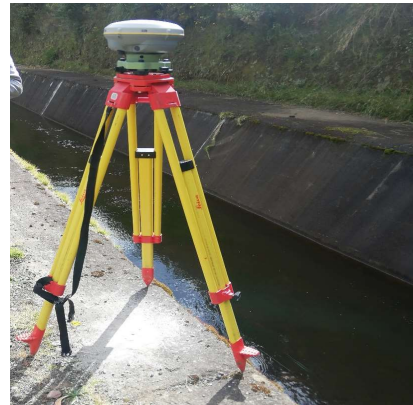
FOTOGRAFÍA DEL MOJON O SITIO DONDE SE ENCUENTRA EL MOJÓN