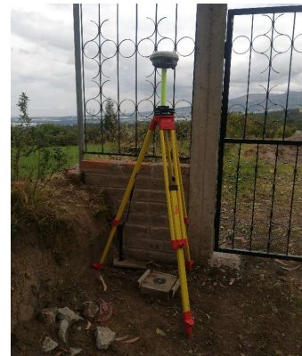
FOTOGRAFIA DEL MOJON O SITIO DONDE SE ENCUENTRA EL MOJÓN