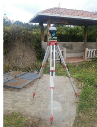
FOTOGRAFIA DEL MOJON O SITIO DONDE SE ENCUENTRA EL MOJÓN