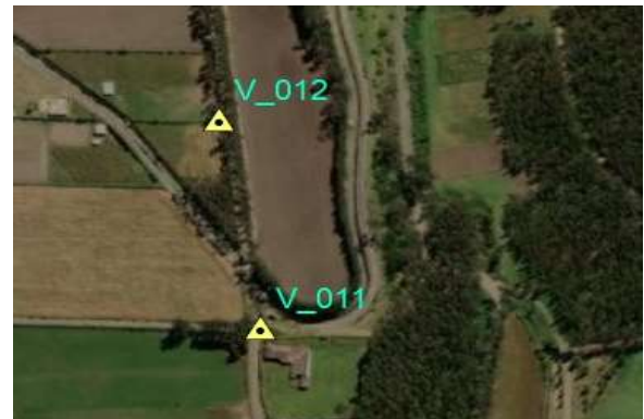
UBICACIÓN EN IMAGEN O FOTOGRAFÍA DEL VERTICE