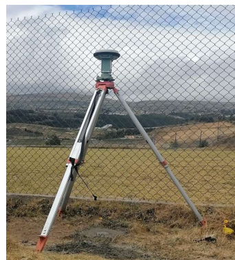
FOTOGRAFIA DEL MOJON O SITIO DONDE SE ENCUENTRA EL MOJÓN