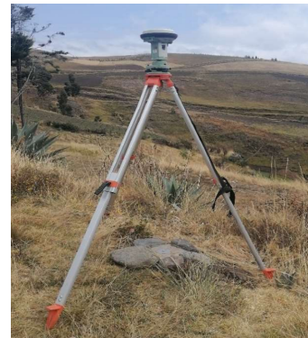
FOTOGRAFIA DEL MOJON O SITIO DONDE SE ENCUENTRA EL MOJÓN