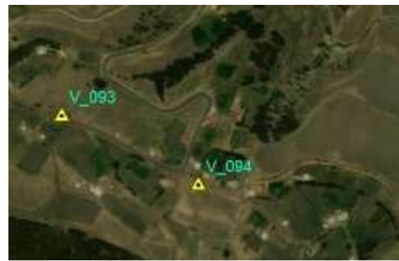
UBICACIÓN EN IMAGEN O FOTOGRAFÍA DEL VERTICE