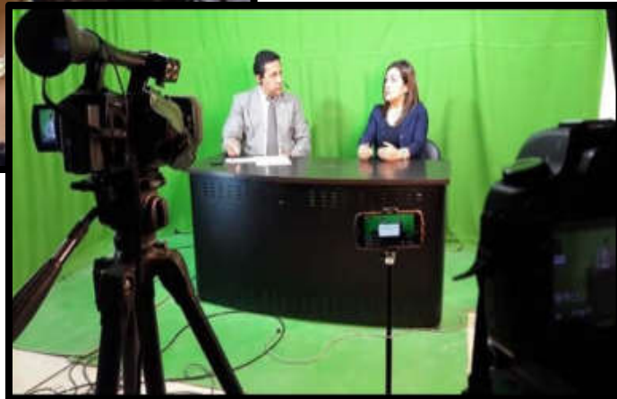
LUZ DE AMÉRICA TV