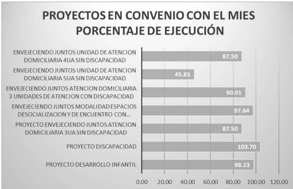
Ilustración 3 Porcentaje de Ejecución Convenios MIES

El proyecto Discapacidad mantiene la óptima ejecución en referencia a las actividades planteadas.