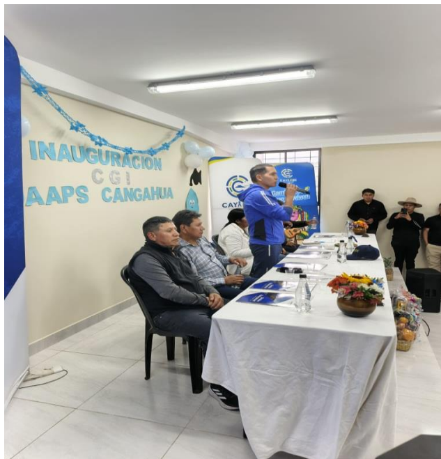
ASISTENCIA A LA FINALIZACIÓN DE OBRA DEL CENTRO DE GESTIÓN INTERCULTURAL DE LAS JUNTAS DE AGUAS DE CONSUMO HUMANO EN EL CENTRO DE URBANO DE CANGAHUA.