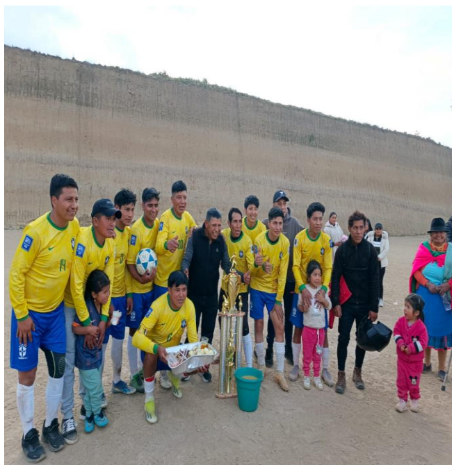
ACOMPañAMIENTO EN LA FINAL DEL CAMPEONATO DEPORTIVO EN LA COMUNIDAD DE SAN PEDRO EN LA PARROQUIA DE CANGAHUA.