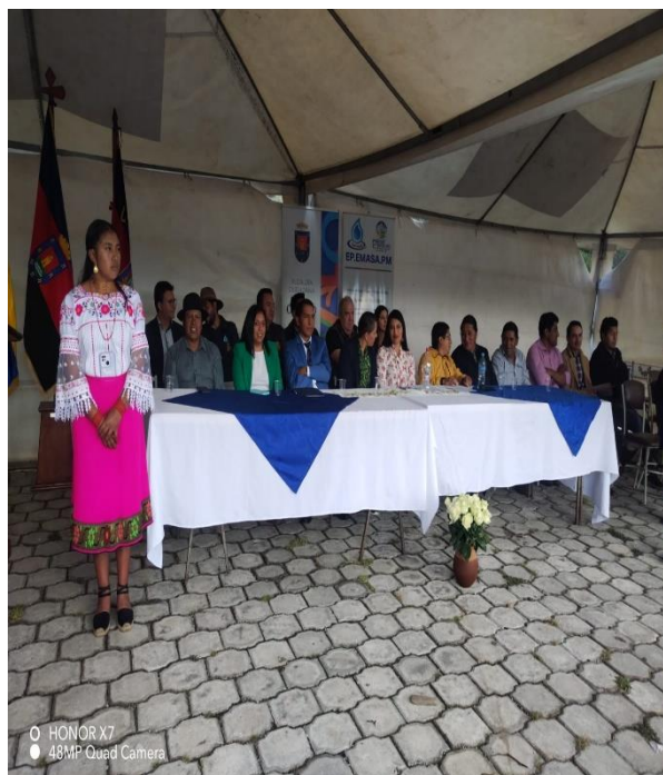
PARTICIPACIÓN EN EL CONVENIO TRIPARTITO ENTRE LAS MUNICIPALIDADES DE OTAVALO, PEDRO MONCAYO Y CAYAMBE, PARA REALIZAR EL ESTUDIO DEL ALCANTARILLADO DE LA COMUNIDAD SAN FRANCISCO DE CAJAS.