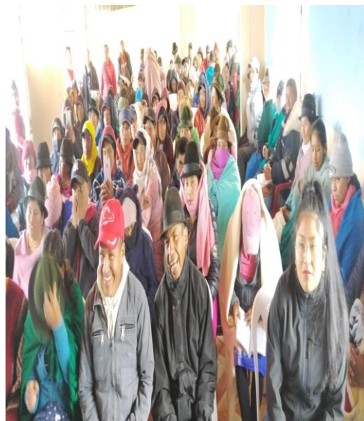
SOCIALIZACIÓN PRESUPUESTO PARTICIPATIVO PARROQUIA DE OTON