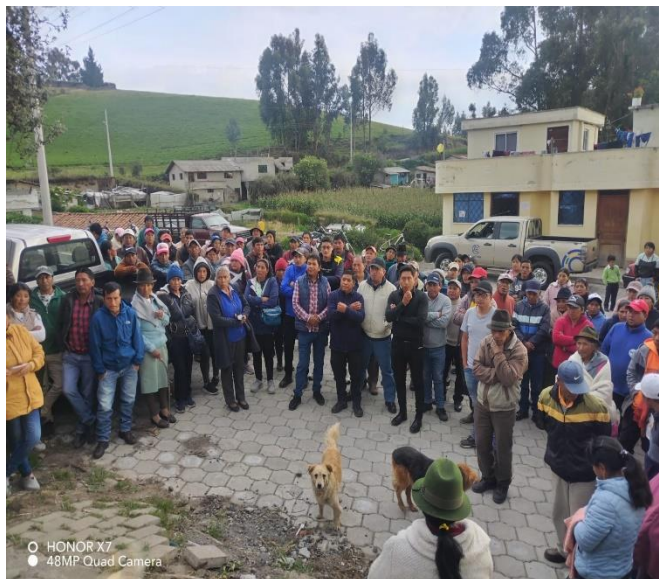
REUNIÓN ENTRE LAS COMUNIDADES DE CONVALECENCIA, MONJAS BAJO, PARROQUIA DE JUAN MONTALVO CON TÉCNICOS RESPONSABLES DEL PROYECTO DE ADOQUINADO.