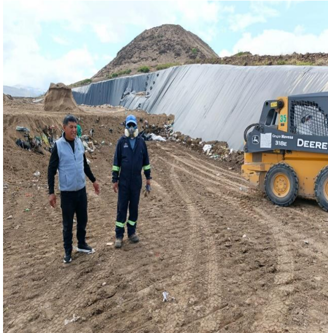
EVALUACIÓN DEL FUNCIONAMIENTO DEL RELLENO SANITARIO UBICADO EN SANTA MARIANITA DE PINGULMÍ DEL CANTÓN CAYAMBE.