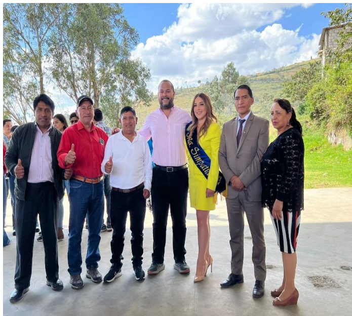
PARTICIPACION EN LA ENTREGA DEL ALCANTARILLADO DE LA PARROQUIA CENTRAL DE CUSUBAMBA Y EL BARRIO EL CAJÓN, REALIZADA POR EL MINISTERIO DE AMBIENTE Y TRANSICIÓN ECOLÓGICA Y AGUA (MATE), CON EL APOORTE DEL MUNICIPIO DE CAYAMBE.