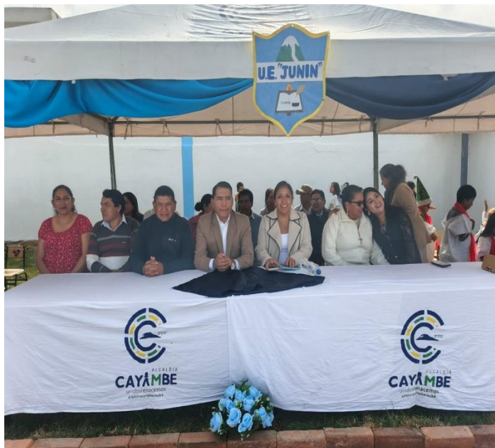
PARTICIPACIÓN EN LA INAUGURACIÓN DEL MEJORAMIENTO DEL ÁREA DE EDUCACIÓN DE LA UNIDAD EDUCATIVA JUNIN.