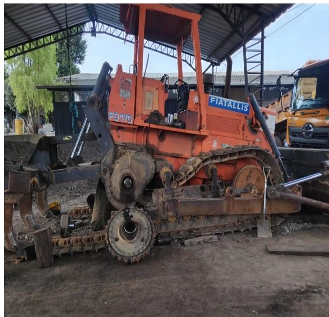
VERIFICACIÓN SOBRE EL DAÑO EN LAS MAQUINARIAS DEL GADIPMC, Y SEGUIMIENTO A SOLUCIONAR EN BENEFICIO DEL CANTÓN.