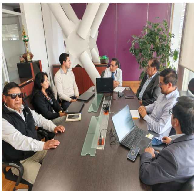
REUNIÓN Y PARTICIPACIÓN EN LA MESA DE TRABAJO TRATANDO EL TEMA DEL PROYECTO PARA ADQUISICIÓN DE MAQUINARIAS PARA EL GADIPMC