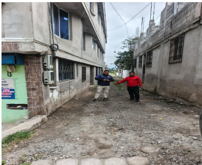
CONSTATACIÓN Y SEGUIMIENTO A LA SITUACIÓN DEL PROCESO NÚMERO SIE 19 EN EL BARRIO SAN JUAN CALLE LA MERCED.