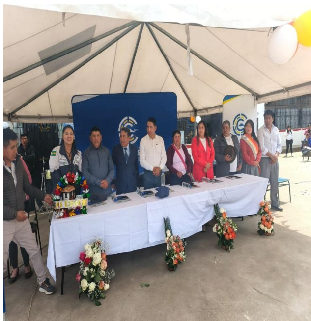
PARTICIPACIÓN A LA INAUGURACIÓN DE DOS AULAS EN LA UNIDAD EDUCATIVA MANUEL ALBAN DE LA PARROQUIA DE JUAN MONTALVO.