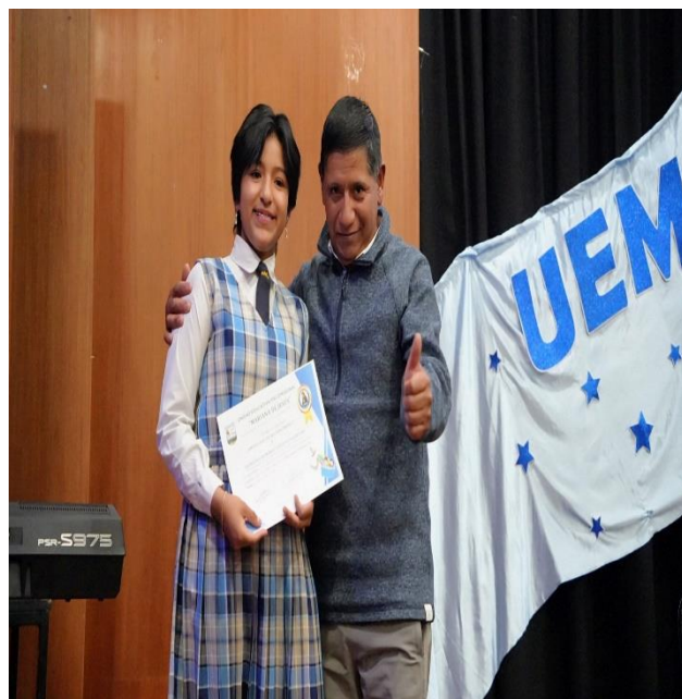
FINALIZACIÓN DEL AÑO ELECTIVO DE LA UNIDAD EDUCATIVA MARIANA DE JESUS.