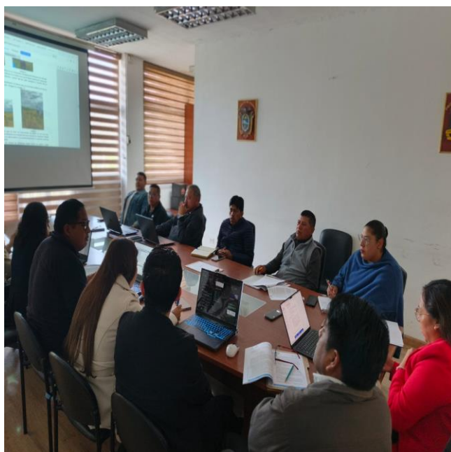
REUNIÓN DE TRABAJO ACERCA DE LA REVISIÓN Y ANÁLISIS DE LA ORDENANZA SUSTITUTIVA A LA ORDENANZA CODIFICADA QUE CONTIENE EL PDOT Y LA REFORMA QUE ADECUA LA "ORDENANZA QUE EXPIDE EL PLAN DE USO Y GESTIÓN DEL SUELO DEL CANTÓN CAYAMBE".