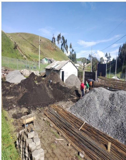
CONSTATACIÓN Y SEGUIMIENTO DEL PROCESO DE CONSTRUCCIÓN DEL CGI, EN LA COMUNIDAD SAN JOSÉ, PARROQUIA DE CANGAHUA.