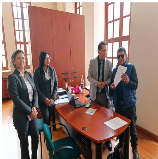
RECOPILANDO INFORMACIÓN EN LA CIUDAD DE AMBATO. PARA ADOPTAR UNA POSIBLE ORDENANZA DE COOPERACIÓN INTERNACIONAL