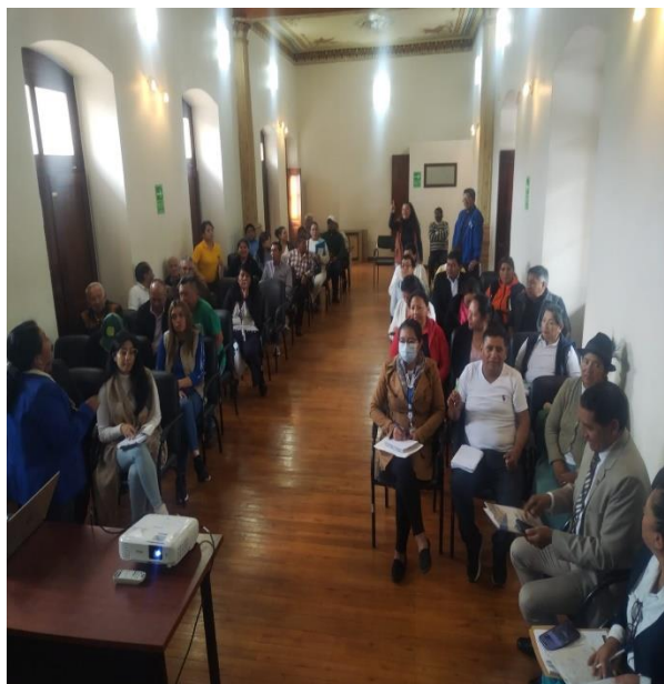
SOCIALIZACIÓN PRESUPUESTO PARTICIPATIVO PARROQUIA DE CUZUBAMBA