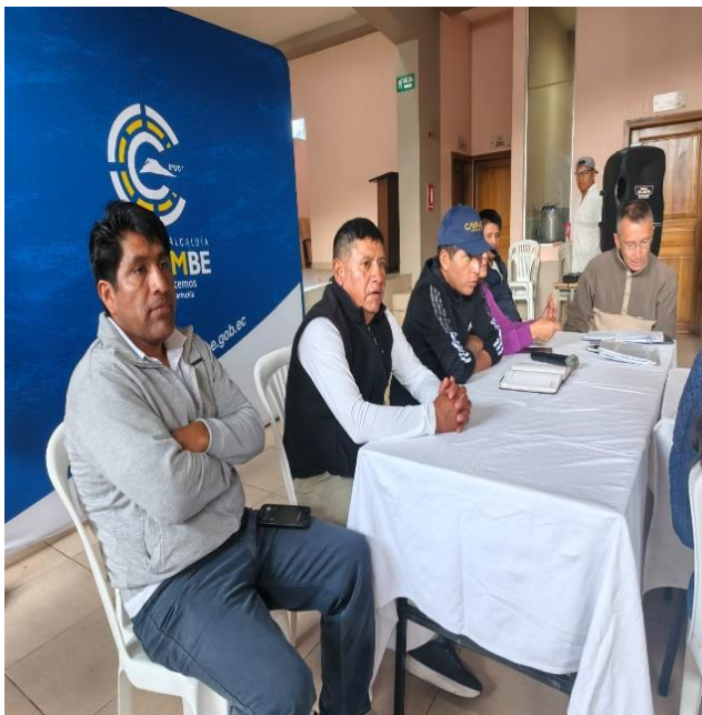
PARTICIPACIÓN EN LA SOCIALIZACIÓN JUNTO AL SEÑOR ALCALDE Y CONCEJALES A LA REUNIÓN DE GESTIÓN DE RIESGOS EN EMERGENCIA CAUSADO POR LA NATURALEZA.