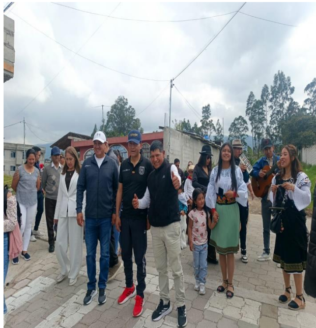
ASISTENCIA A LA TERMINACIÓN DE OBRA DEL ADOQUINADO DEL BARRIO EL CARMEN PARROQUIA ASCÁZUBI