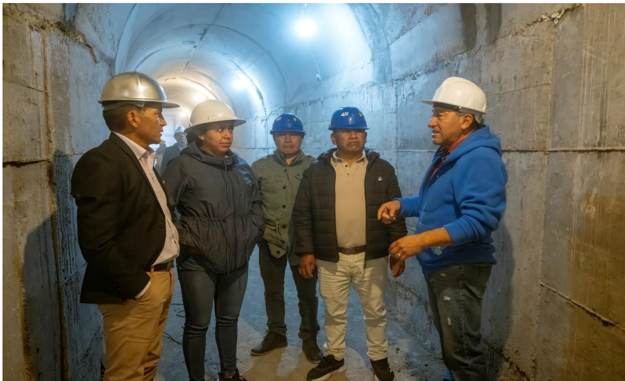
REVISIÓN DEL AVANCE CONJUNTAMENTE CON EL ALCALDE Y CONCEJALES DE LA OBRA DEL TRASVASE EL TUMBE EN EL BARRIO ÁLVAREZ Y CHIRIBOGA DE LA CIUDAD DE CAYAMBE