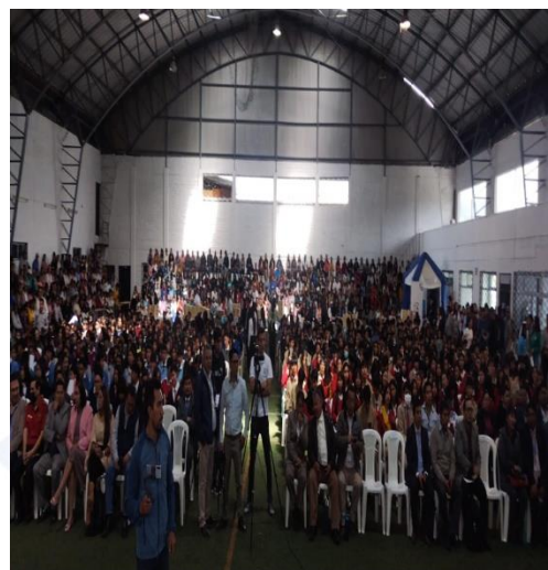
SOCIALIZACIÓN PRESUPUESTO PARTICIPATIVO PARROQUIA DE CANGAHUA