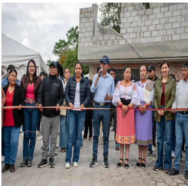
ASISTENCIA A LA INAUGURACIÓN DE LA FINALIZACIÓN DE OBRA DEL ADOQUINADO EN EL BARRIO LA ESTACIÓN COMUNIDAD SAN LUIS DE GUACHALA PARROQUIA CANGAHUA.