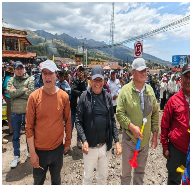
ACOMPAÑAMIENTO A LAS COMUNIDADES AL RECHAZO DEL ALZA DE LOS COMBUSTIBLES DIESEL Y GASOLINA AFECTANDO ACTUALMENTE A LA CIUDADANIA.