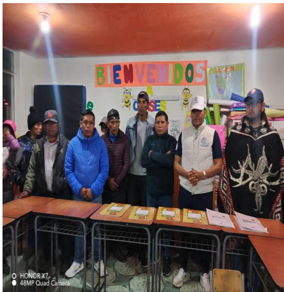
SOCIALIZACIÓN PRESUPUESTO PARTICIPATIVO PARROQUIA DE ASCAZUBI