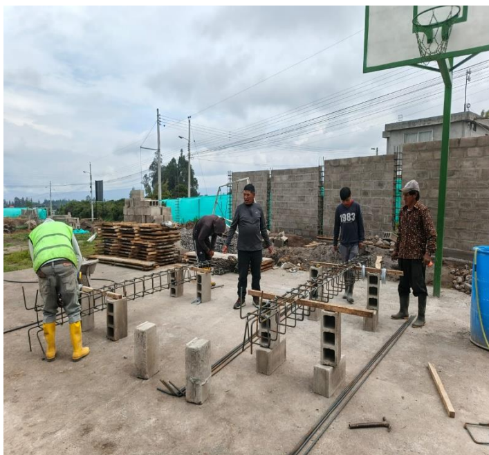
FISCALIZACIÓN DE LA OBRA SOBRE LA CONSTRUCCIÓN DEL CERRAMIENTO DE LA CANCHA SINTÉTICA DE LA COMUNIDAD MILAGRO-PARROQUIA CANGAHUA