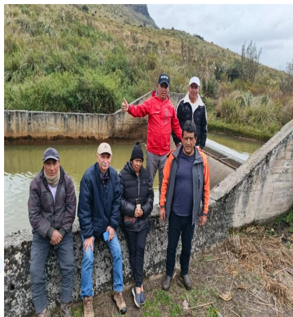
RECORRIDO CON REPRESENTANTES DE LA FUNDACIÓN AFI INTERNACIONAL Y TÉCNICOS DE LA DIRECCIÓN DE OBRAS PÚBLICAS, CONJUNTAMENTE CON DIRIGENTES DE LA JUNTA GUANGUILQUI POROTOG.