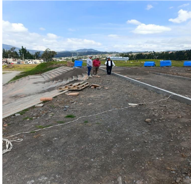
FISCALIZACIÓN DE LA OBRA Y MATERIALES POR EJECUTARSE EN EL PARQUE LA REMONTA EN LA PARROQUIA DE SAN JOSÉ DE AYORA.