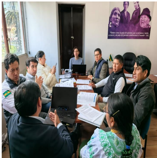
REUNIÓN DE TRABAJO PARA TRATAR EL TEMA DEL ANÁLISIS DE LAS COMPETENCIAS PARA LA RECOLECCIÓN DE RESIDUOS SÓLIDOS EN EL CANTÓN CAYAMBE.