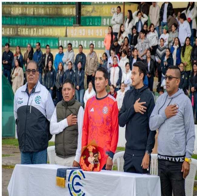
PARTICIPACIÓN EN LA INAUGURACIÓN DEL CAMPEONATO DEPORTIVO INSTITUCIONAL DEL GADIPMC Y LAS INSTITUCIONES ADSCRITAS.