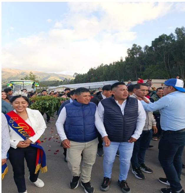
ACOMPAÑAMIENTO EN LA FINALIZACIÓN DEL ASFALTADO 2.5KM EN LA COMUNIDAD DE SANTO DOMINGO NUMERO 1 Y 2.