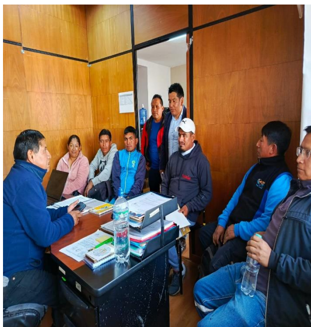
DESARROLLO DE LA REUNIÓN CON LA COMUNIDAD DE SANTA MARIANITA PINGULMI, POR LOS INCONVENIENTES CAUSADOS EN EL RELLENO SANITARIO Y BUSCANDO SOLUCIONES.