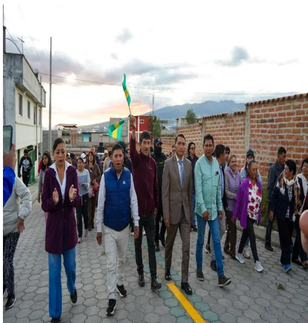
ACOMPAÑAMIENTO A LA FINALIZACIÓN DE OBRA DEL ADOQUINADO EN EL BARRIO ALVAREZ Y CHIRIBOGA EN LA CIUDAD DE CAYAMBE.