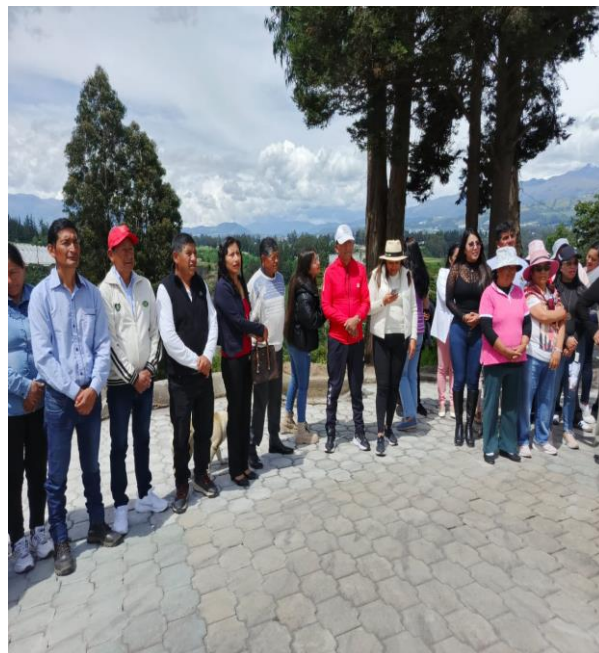
FISCALIZACIÓN DE LA TERMINACIÓN DE VÍA ADOQUINADA EN LA COMUNIDAD SAN LUIS DE GUACHALA, CONJUNTAMENTE CON EL SEÑOR ALCALDE Y EL PRESIDENTE DE LA JUNTA PARROQUIAL DE CANGAHUA.