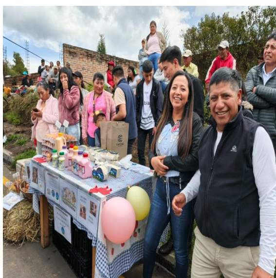
ACOMPAÑAMIENTO A LA TERMINACIÓN DE OBRA DEL ASFALTADO DE 2 KM EN LAS COMUNIDADES DE ANCHOLAG DEL CANTÓN CAYAMBE.