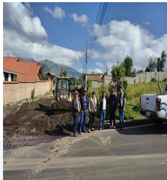
FISCALIZACIÓN DEL FUNCIONAMIENTO DE MAQUINARIAS Y MATERIALES PARA LAS OBRAS VIALES DE LA PARROQUIA DE AYORA.