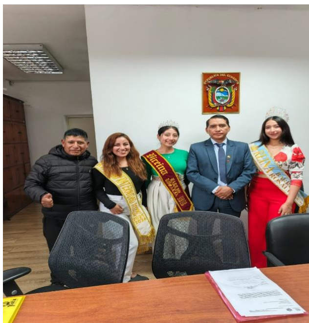
ACOMPAÑAMIENTO A LAS SOBERANAS ELECTAS DEL BARRIO ROSALÍA SANTA ROSA DE CUSUBAMBA.