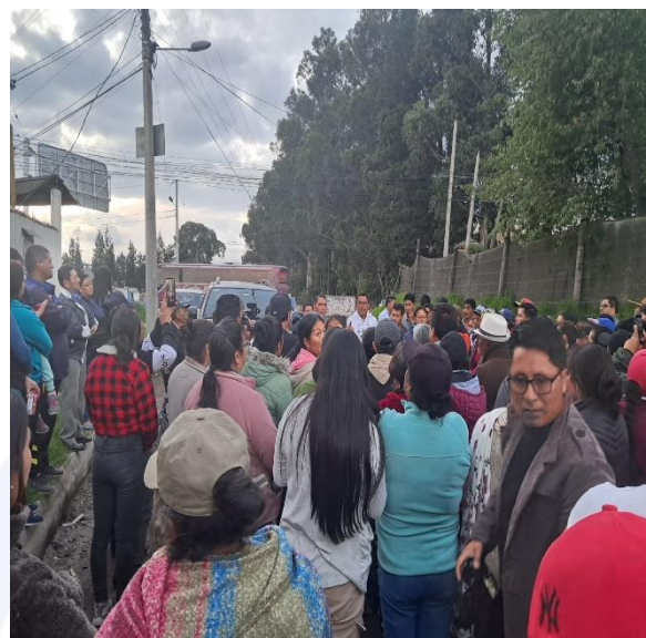
FISCALIZACIÓN A LA ENTREGA DEL ADOQUINADO DE LA CALLE H JARRIN, BARRIO PRIMERO DE MAYO DE LA PARROQUIA JUAN MONTALVO.