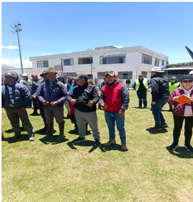
PARTICIPACIÓN EN LA SOCIALIZACIÓN DE PROYECTO DE LA REPRESA DE AGUAS DE LAS JUNTAS DE AGUAS GUANGUILQUI – POROTOG.