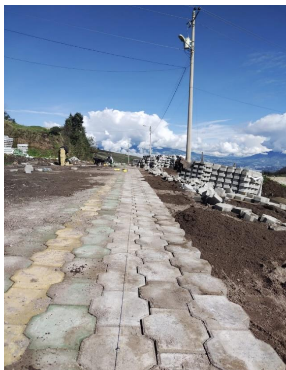
FISCALIZACIÓN AL ADOQUINADO DE LA VÍA, EN EL CENTRO POBLADO DE LA PARROQUIA DE CANGAHUA.