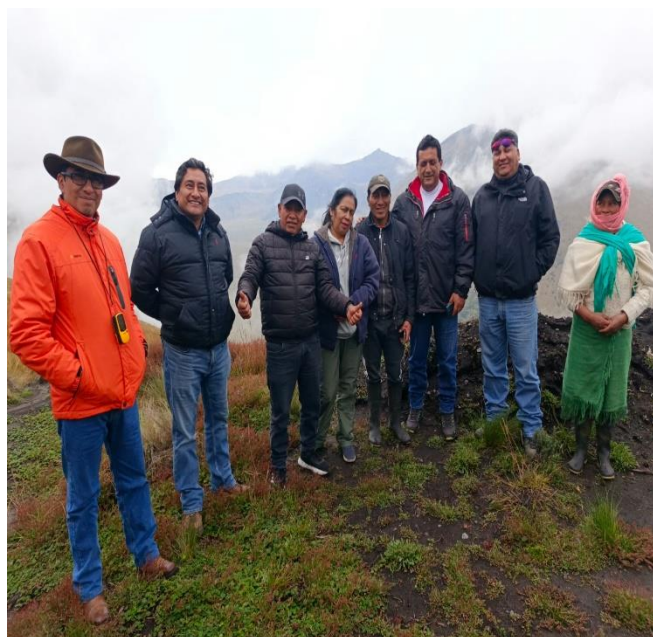
ACOMPañAMIENTO Y RECORRIDO PARA LA VERIFICACIÓN PARA EL CONSUMO HUMANO DE LAS JUNTAS DE LAS COMPAÑÍAS DE AGUAS, PARROQUIA CANGAHUA.