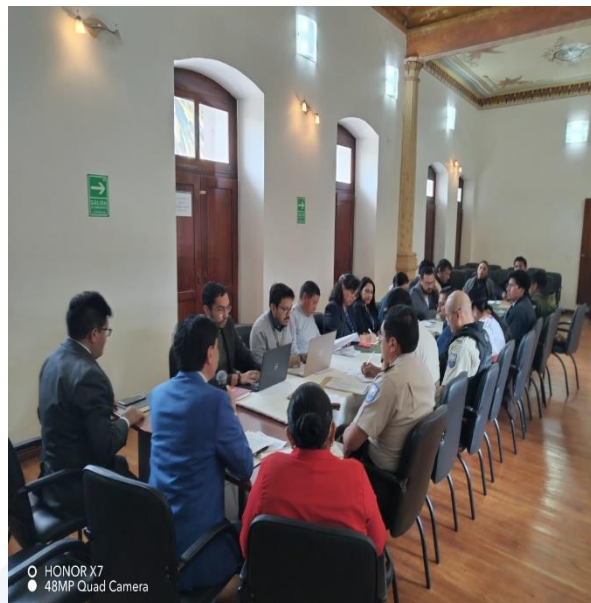
PARTICIPACIÓN ACTIVA EN LA REUNIÓN DEL COMITÉ INTERINSTITUCIONAL DE SEGURIDAD DEL CANTÓN CAYAMBE, CONJUNTAMENTE CON LOS TÉCNICOS Y DEMÁS CONCEJALES.