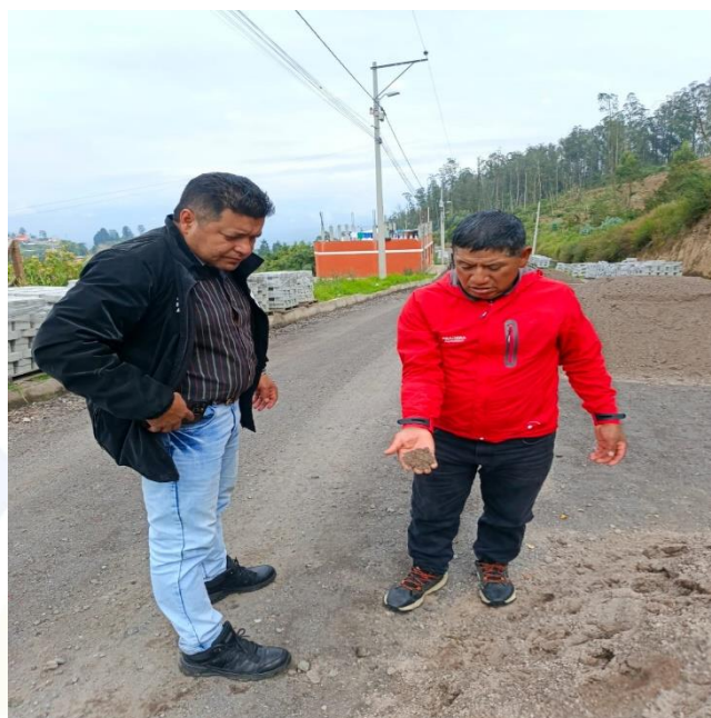
FISCALIZACIÓN DE LA CONSTRUCCIÓN DEL ESTADIO EN EL BARRIO EL CAJÓN DE SANTA ROSA DE CUSUBAMBA.