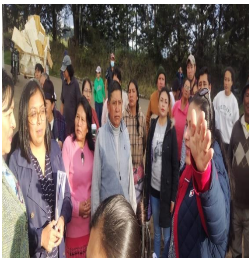
SOCIALIZACIÓN PRESUPUESTO PARTICIPATIVO PARROQUIA DE AYORA