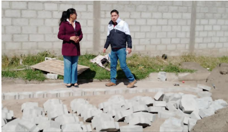
REUNION DE TRABAJO PRE COOPERATIVA DE TRANSPORTES ASCAZUBI