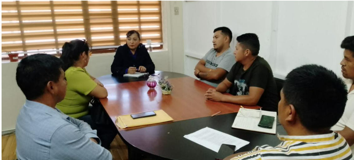
REUNION DE TRABAJO CON EMAPAAC-EP SOBRE DESECHOS SOLIDOS