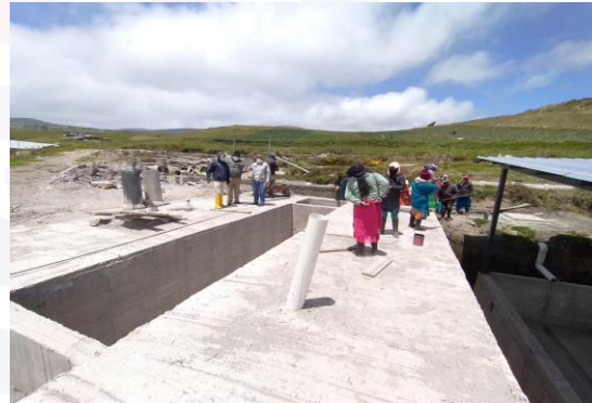
Cangahua COINCA Alcantarillado