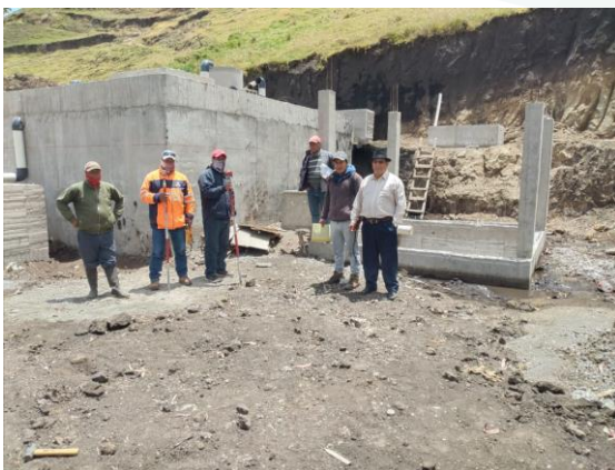
Comuna La Libertad Alcantarillado