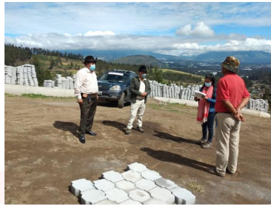
Buena Esperanza Adoquinado