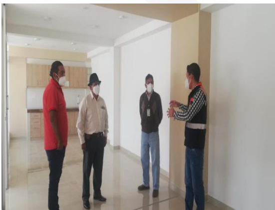
GADIPMC Edificio de Archivos