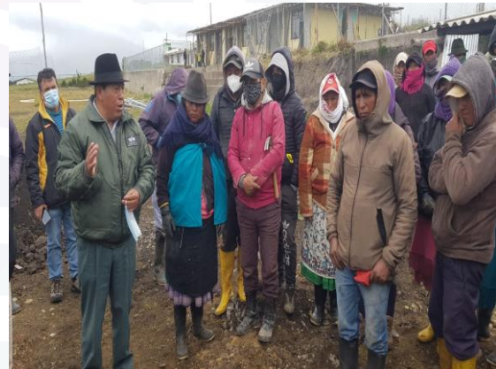
Larcachaca seguimiento de obra