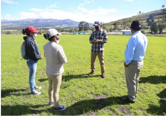
Santa Rosa Pingulmí Estadio