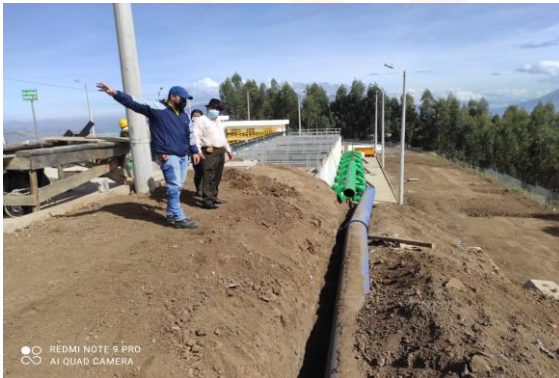
Tanques de reserva de aguas de consumo de Wayku Machay