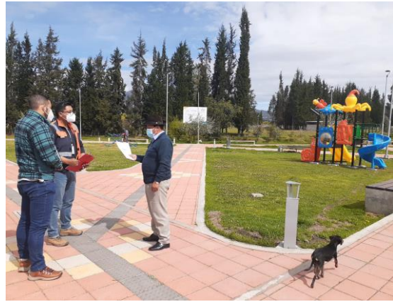
Cayambe Colegio Técnico fiscalización Maquinaria