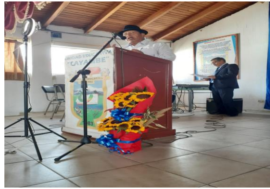
Reunión con Junta Regional Larcachaca Carrera Porotog Moras Cayambe 29-11-2021