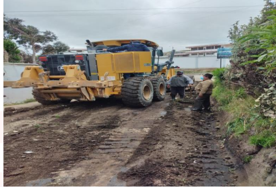
La Libertad seguimiento de trabajo de maquinaria de GADIPMC