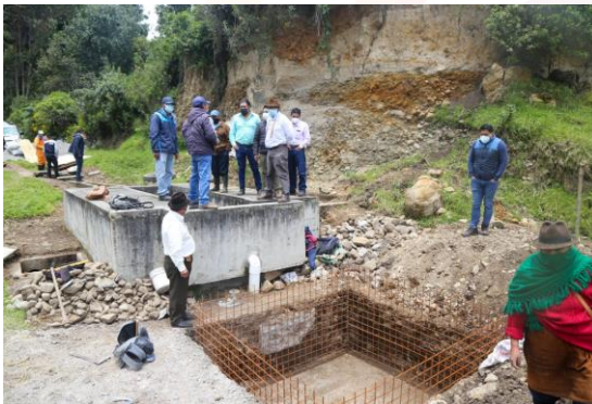
Paquiestancia Tanque tratamiento De aguas residuales