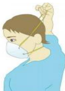
Imagen 3: Procedimiento de retiro de mascarilla.