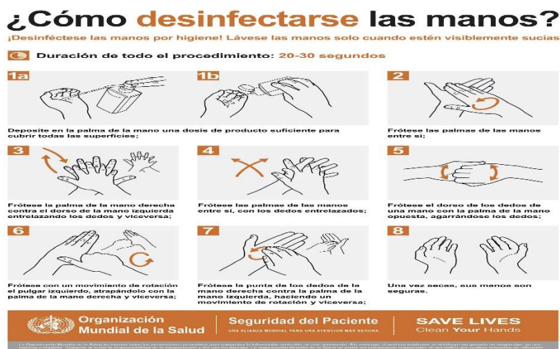
Imagen 1: Procedimiento de desinfección de manos.