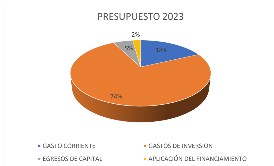
Gráfico: Resumen de Gastos

Los gastos corrientes para el año 2023 ascienden a USD 5,579,082.70 que representan el 18% del total de gastos. Los gastos de inversión para el año 2023 son de USD 23,064,241.21 que representan el 74% del total de egresos. Los gastos de capital son de USD 1,672,265.67 representan el 5%. La aplicación del financiamiento es de USD 669,476.13 la cual representa el 2%.